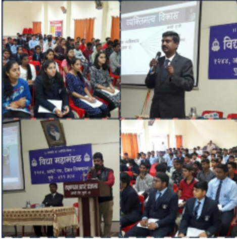
पुणे - लक्ष्मणराव आपटे प्रशाला व कनिष्ठ विद्यालय, पुणे ४ या माझ्या कॉलेजमध्ये इ.१२ वी च्या विद्यार्थ्यांना 'व्यक्तिमत्व विकास' या विषयावर मार्गदर्शन करताना...