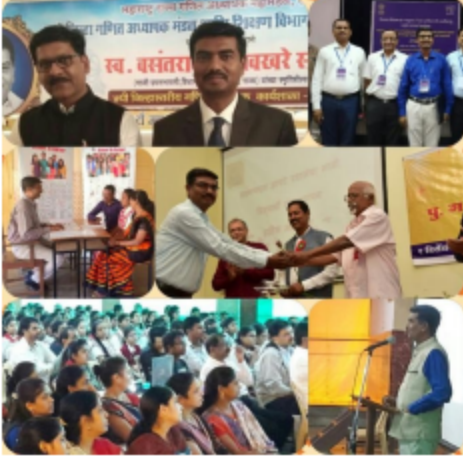
पुणे (लोणावळा) - १०वीच्या करिअर कसे निवडावे?.. या विषयावर विद्यार्थ्यांना मार्गदर्शन करताना...