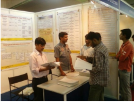
पुणे - विद्यार्थ्यांना करिअर मार्गदर्शन करताना ....