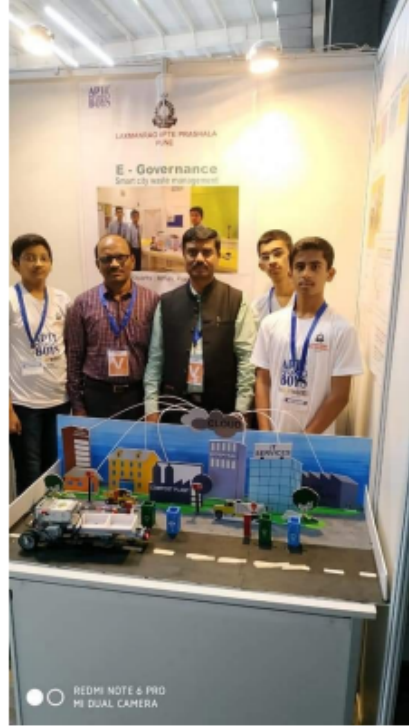
दिल्ली - वर्ड रोबोटिक ऑलिंपियाड मध्ये सहभाग