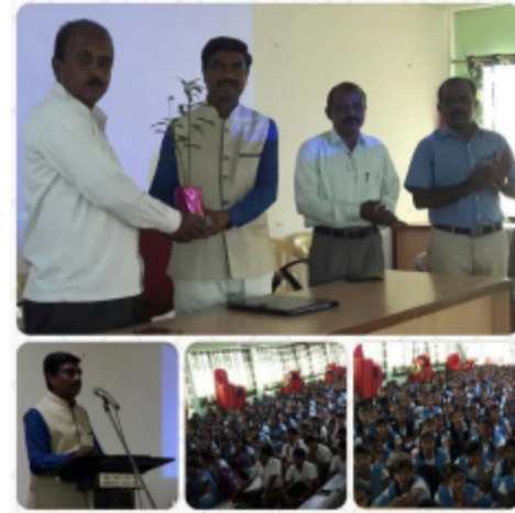
पुणे (इंद्रापूर) - १०वी व १२वीच्या परीक्षेला सामोरे जाताना.. या विषयावर विद्यार्थ्यांना मार्गदर्शन करताना...