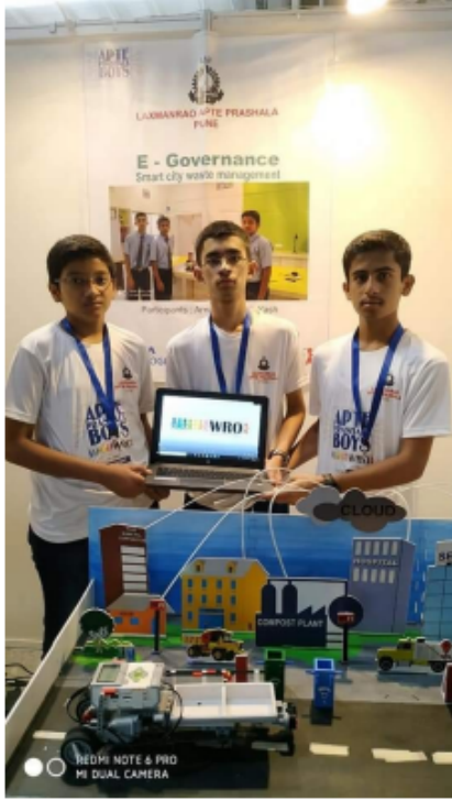
दिल्ली - वर्ड रोबोटिक ऑलिंपियाड मध्ये सहभाग