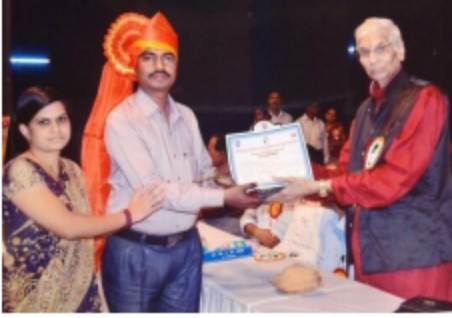
मुख्याध्यापक संघ पुणे यांचा आदर्श शिक्षक पुरस्कार- सन २०१४