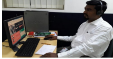
'करिअर मित्र' या राज्याच्या हेल्पलाईनवरून विद्यार्थ्यांना मार्गदर्शन करताना....