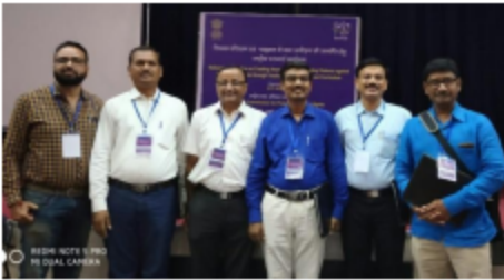
रामभाऊ महाळगी प्रबोधनी, दहिसर ठाणे