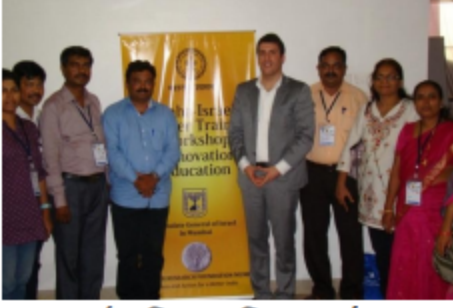
“महा इस्राईल शिक्षण प्रशिक्षण कार्यशाळा प्रयोगशील शाळा सृजनशील समाज”मध्ये विशेष शिक्षक समुपदेशक म्हणून सहभाग.