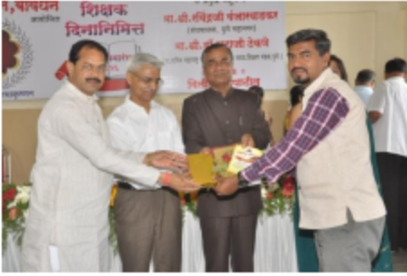
राष्ट्र सेवा प्रतिष्ठान पुणे यांचा आदर्श शिक्षक पुरस्कार- सन२०१६