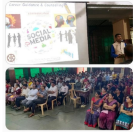
पुणे (लोणावळा) - १०वीच्या अभ्यास कौशल्य - तंत्र वा मंत्र... या विषयावर विद्यार्थ्यांना मार्गदर्शन करताना...