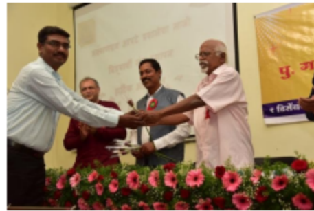
लक्ष्मणराव आपटे प्रशाला, पुणे ४