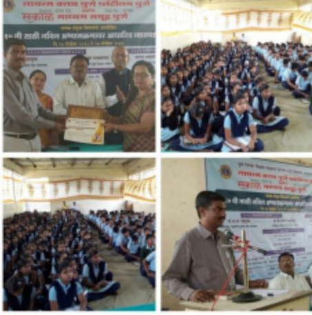
पुणे (खानापूर) - १०वीच्या परीक्षेला सामोरे जाताना.. या विषयावर विद्यार्थ्यांना मार्गदर्शन करताना...