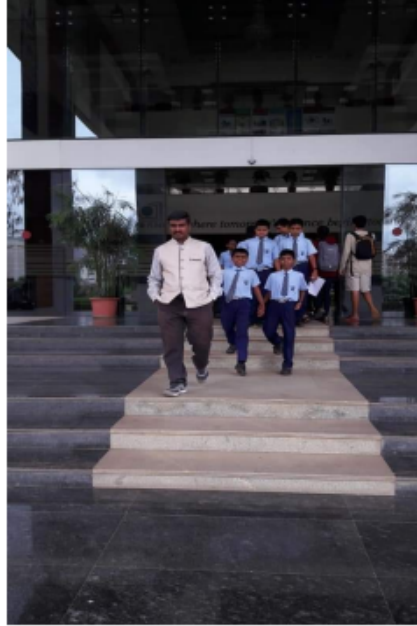
शैक्षणिक भेट - आयसर, पुणे