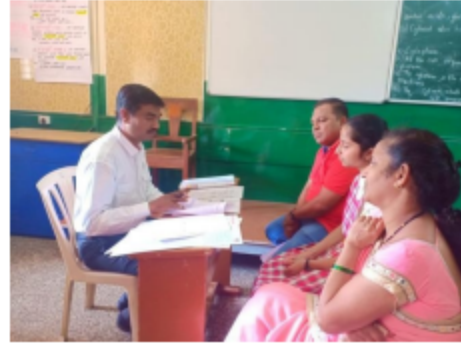
लोणावळा - विद्यार्थ्यांची कलचाचणी घेऊन करिअर संवाद, मार्गदर्शन व समुपदेशन करताना ....