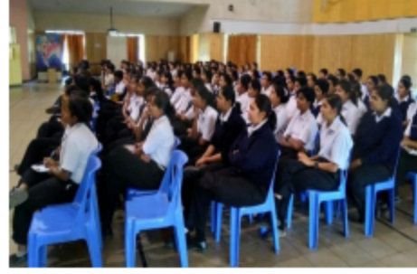
पुणे (लोणावळा) - १०वीच्या करिअर कसे निवडावे?.. या विषयावर विद्यार्थ्यांना मार्गदर्शन करताना...