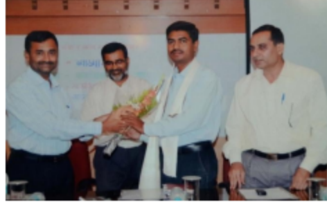
यशवंतराव मोहिते महाविद्यालय ,पुणे ३८